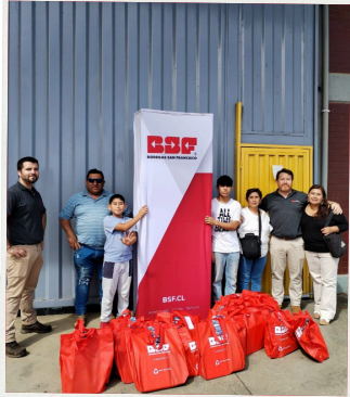
Comunidad José Manuel Millapán Temuco