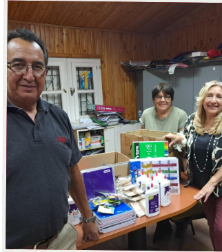
Escuela Paul Harris Chillán