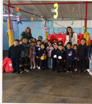
Escuela Estado de Florida Pudahuel