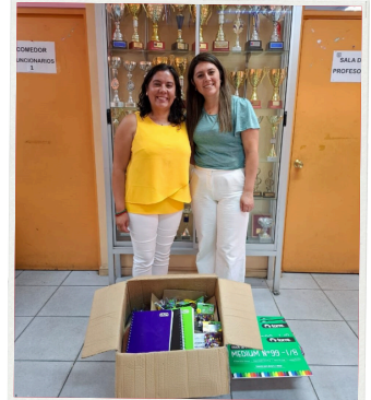
Escuela Melvin Jones Pudahuel

En total, 109 niños fueron beneficiados, abarcando los niveles de kínder y prekínder, mientras que en las agrupaciones mapuches, los beneficiarios incluyen niños y jóvenes desde kínder hasta 4to medio.